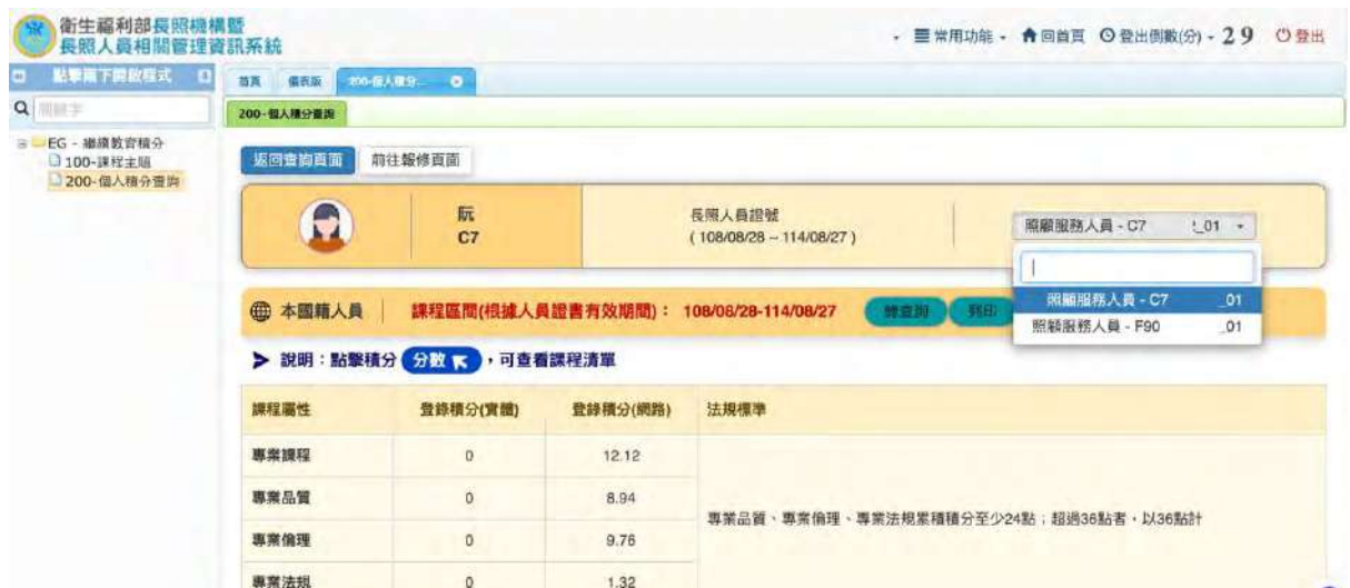
圖 7 重複發證導致認證整併未歸戶畫面