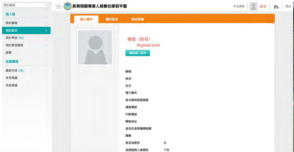
圖 2 長期照顧專業人員數位學習平台個人資料畫面