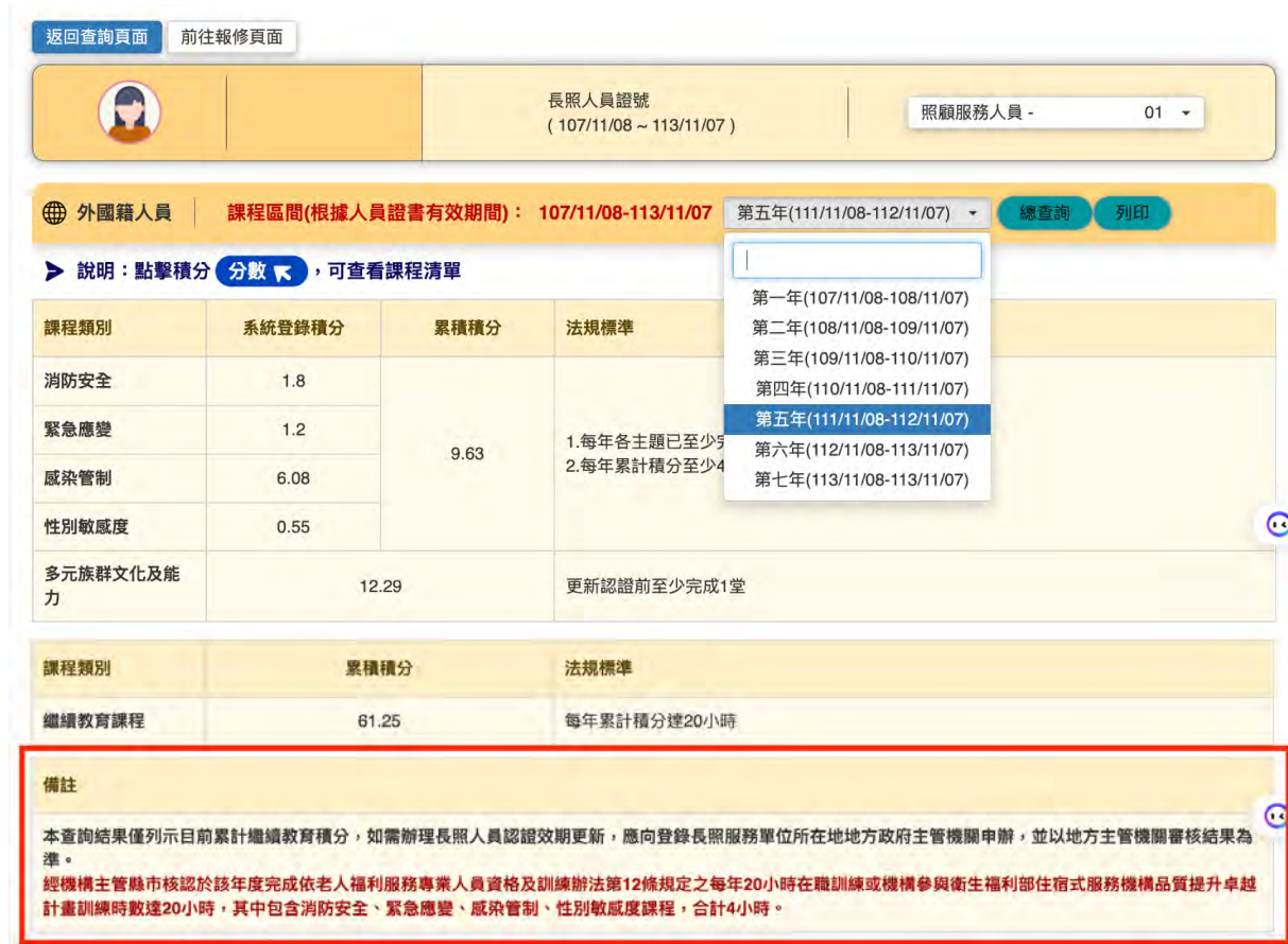
圖 4 疫情期間老人福利機構在職訓練時數抵免畫面